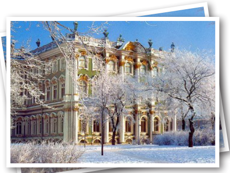
Cung điện mùa đông