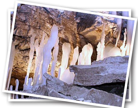
Núi đá vôi Kungur: một trong những núi đá vôi độc đáo, lớn nhất ở Nga.