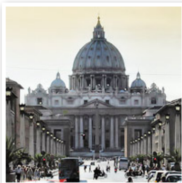
Saint Petersburg là cố đô và là thành phố lớn thứ hai của nước Nga