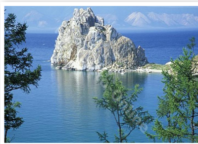
Hồ Baican - hồ sâu và cổ nhất thế giới, được mệnh danh là “viên ngọc Siberia”

Hình ảnh ấy cũng sẽ còn mãi trong tim những người bạn của nước Nga. □