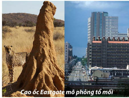
Cao ốc Eastgate mô phỏng tổ mối

Bản chất vấn đề nằm ở những protein nhỏ trong các tế bào của loài này có tính chuyển biến cao, giúp sắp xếp lại các tinh thể sắc tố trên da. Từ lâu, con người đã bắt chước tắc kè, mặc những bộ quân phục có hoa văn “rằn ri”, có sọc như hổ, hay màu đất để ẩn mình trong khu vực chiến đấu. Tùy theo khu vực hoạt động sẽ có những hoa văn và màu sắc khác nhau. Trong tương lai không xa, những bộ quân phục rằn ri này sẽ dần nhường chỗ cho thể hệ áo ngụy trang công nghệ cao may bằng loại vải phỏng sinh học, có các protein linh hoạt để biến đổi màu sắc cho phù hợp với môi trường, chức năng tương tự như da tắc kè. Tuy nhiên, sẽ mất khoảng 5-10 năm nữa trước khi loại quân phục “tắc kè hoa” đặc biệt này được nghiên cứu hoàn chỉnh và tung ra thị trường.