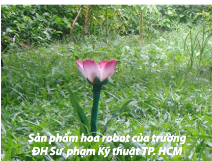
Sản phẩm hoa robot của trường ĐH Sư phạm Kỹ thuật TP. HCM

Năm 2010, Berkeley Bionics (California) trình làng bộ xương máy eLEGs, điều khiển bởi máy tính và được thiết kế dành riêng cho những người bị liệt 2 chân, giúp họ có thể đi đứng dễ