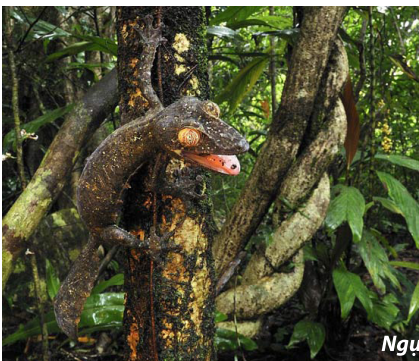
Ngụy trang kiểu tắc kè

Ngành quân sự - nghệ thuật ngụy trang kiểu tắc kè: để tự vệ, nhiều loại động vật đã sở hữu một bản năng hóa trang cực kỳ tinh tế. Tắc kè là một trong những sản phẩm ngoạn mục của tự nhiên. Chúng thay đổi màu sắc trên da để tương đồng và “hòa lẫn” vào khung cảnh xung quanh, khiến chúng hoàn toàn “tàng hình” trong mắt kẻ thù.