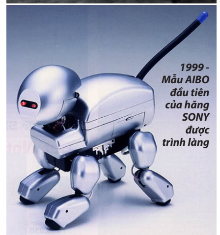
1999 - Mẫu AIBO đầu tiên của hãng SONY được trình làng