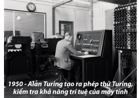
1950 - Alan Turing tạo ra phép thử Turing, kiểm tra khả năng trí tuệ của máy tính