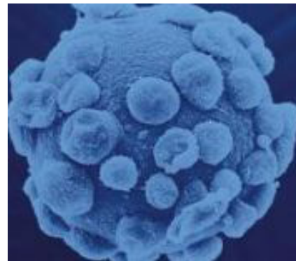
Vi rút PRRS

Kết quả cho thấy, tình hình nhiễm vi rút PRRS trên đàn heo sinh sản của TP.HCM ở mức báo động, tỷ lệ