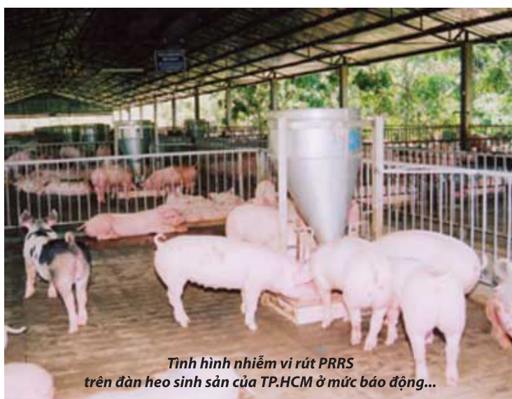
Tình hình nhiễm vi rút PRRS trên đàn heo sinh sản của TP.HCM ở mức báo động...

Nhóm tác giả cũng đã tiến hành phân lập được 7 chủng vi rút PRRS từ mẫu thực địa; xây dựng quy trình phân biệt vi rút PRRS chủng vắc xin và chủng thực địa. Bằng việc giải và so sánh trình tự nucleotide của các đoạn ORF5, ORF7, nsp2, đề tài đã xác định được độ tương đồng của vi rút PRRS thực địa trên đàn heo sinh sản ở TP.HCM trong nghiên cứu thuộc phân nhóm nhỏ 2.3 kiểu gen Bắc Mỹ, cùng nhóm với vi rút PRRS phân lập tại Quảng Nam năm 2007 và với các chủng Trung Quốc độc lực cao phân lập vào năm 2006, 2007. Các chủng vi rút PRRS trong nghiên cứu có độ tương đồng thấp so với chủng vi rút PRRS Bắc Mỹ cổ điển VR-2332 (86,6-87,65%) và PRRS vắc xin nhược độc MLV-RespPRRS (86,2-87,4%), Besta (85,9-86,7%) và MLV- PrimePac (88,1-89,1%). □