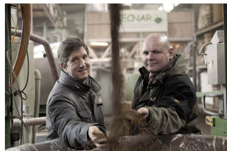
Hai nhà khoa học Đức Jürgen Pfitzer (bên phải) và Helmut Nägele (bên trái) - tác giả công trình nghiên cứu về Arboform

Tóm lại là tất tần tật những gì có thể làm từ gỗ, nhưng hình dạng phức tạp mà gỗ khó tạo hình, hoặc thậm chí những sản phẩm mà không ai nghĩ