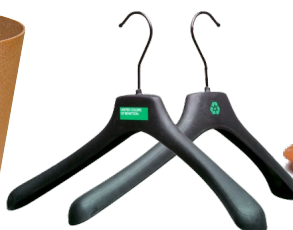
Hàng gia dụng