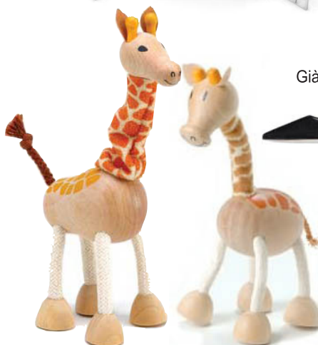
Đồ chơi trẻ em