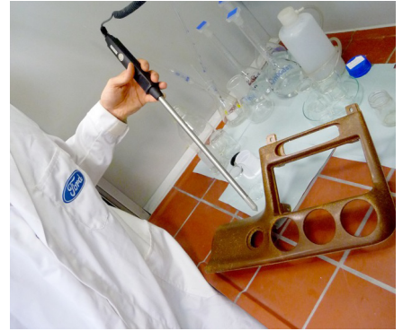
Một chi tiết trên xe Ford làm bằng arboform

Hạn chế hiện có của arboform là giá thành so với mặt hàng nhựa. Tuy nhiên, theo các chuyên gia về thị trường nhựa sinh học, nếu giá dầu thô tăng gấp 2 trong tương lai, thì giá nhựa sẽ tăng mạnh từ 30-40%. Với quy trình sản xuất không hề sử dụng dầu, giám đốc điều hành công ty Tecnar cho biết: “Tôi tin rằng arboform sớm có thể cạnh tranh với mặt hàng nhựa”. Chất dẻo “xanh” rẻ hơn so với nhựa,