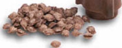
Arboform thô có dạng viên

như sợi gai dầu, sợi lanh, thêm vào một số phụ gia như sáp,... sẽ được một chất giống như hỗn hợp chất xơ và nhựa kết tinh - đó là arboform. Arboform thô thương phẩm có dạng viên, hơi đục, màu nâu như gỗ tự nhiên, khi được xử lý ở nhiệt độ và áp suất cao sẽ nóng chảy, có thể đúc, ép, đổ khuôn để tạo hình dạng mong muốn, tương tự như nhựa nhiệt tổng hợp.