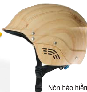
Nón bảo hiểm