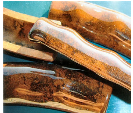
Arboform trông như gỗ được đánh bóng, có thể trở nên mềm dẻo dưới nhiệt độ và áp suất thích hợp

- Không chỉ giúp giảm lượng nhựa độc hại thải ra hàng năm, arboform còn tiết kiệm hàng triệu thùng dầu tiêu tốn cho ngành công nghiệp chất dẻo.