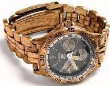
Đồng hồ Wood Watch