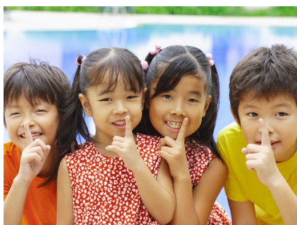
Ngôn ngữ ký hiệu giúp bé chia sẻ và kết bạn

Ngôn ngữ ký hiệu (NNKH) hay còn gọi là “thủ ngữ”- là phương tiện ngôn ngữ phổ biến nhất trong cộng đồng người câm điếc, sử dụng chuyển động của cơ thể (điệu bộ, tay chân, nét mặt...) để giao tiếp với những người xung quanh.