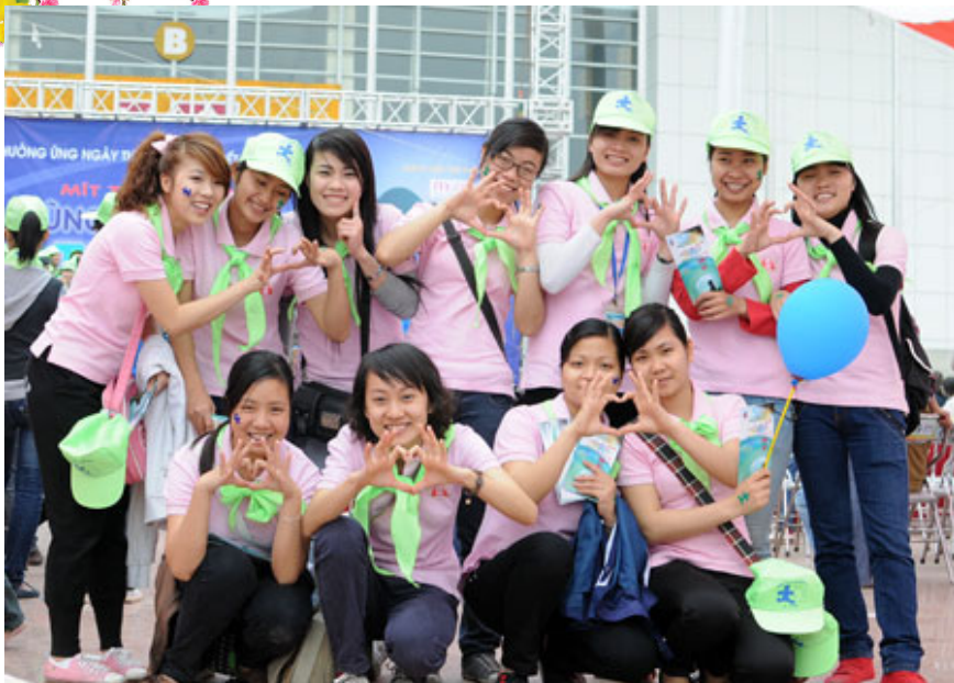
CLB Ngôn ngữ ký hiệu Tp. Hồ Chí Minh

- Giao tiếp với người khiếm thính : học NNNH cũng là cách thể hiện lòng nhân ái, bạn có thể góp phần giúp những người khuyết tật hòa nhập với xã hội. Cộng đồng người câm điếc có rất nhiều khác biệt trong tư duy và lối sống. Do đó bạn sẽ khám phá rất nhiều điểm thú vị khi đến với loại ngôn ngữ này.