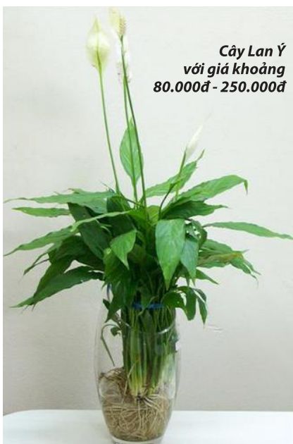
Cây Lan Ý với giá khoảng 80.000đ - 250.000đ