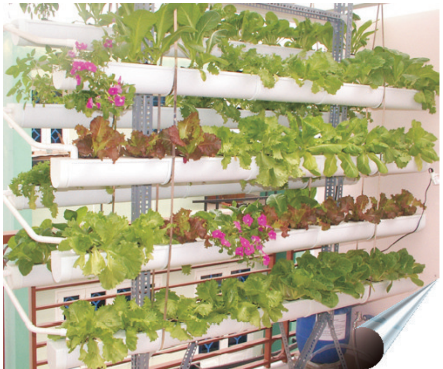
Hệ thống tháp đứng thủy canh để trồng rau và cả hoa kiểng

Một bình thủy tinh trên bàn với một loại cây trồng yêu thích là bạn có thể trang trí, làm mát văn phòng mà không cần phải thay đổi, tốn kém nhiều lần như chưng hoa, hay trồng kiểng lá trong chậu đất vừa công kênh vừa phải tưới nước. Trồng thủy canh cây cảnh đơn giản, tiện lợi hơn nhiều. Chỉ cần một chậu thủy tinh, một giỏ nhựa có kích cỡ phù hợp với cây, sau đó tách cây từ chậu đất, dùng nước rửa sạch rễ, đặt cây vào giỏ nhựa và đưa vào chậu thủy tinh chứa nước