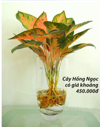
Cây Hồng Ngọc có giá khoảng 450.000đ