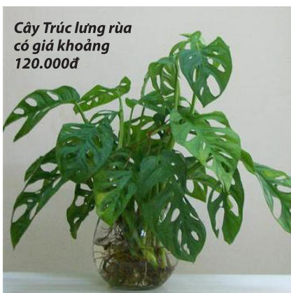
Cây Trúc lừng rùa có giá khoảng 120.000đ