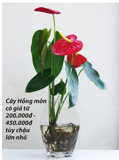
Cây Hồng môn có giá từ 200.000đ - 450.000đ tùy chậu lớn nhỏ