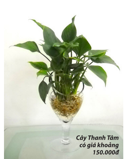
Cây Thanh Tâm có giá khoảng 150.000đ