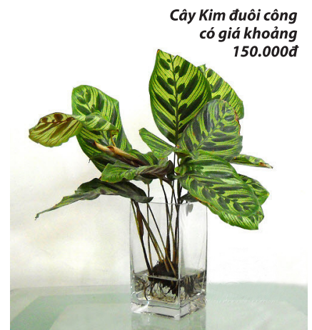
Cây Kim đuôi công có giá khoảng 150.000đ