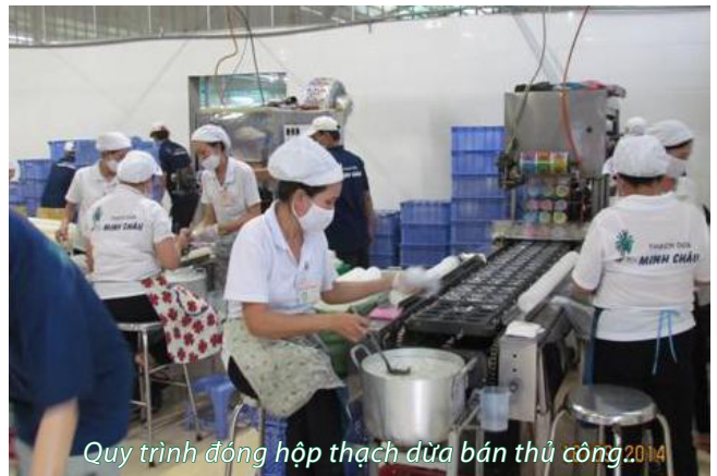
Quy trình đóng hộp thạch dừa bán thủ công 2014