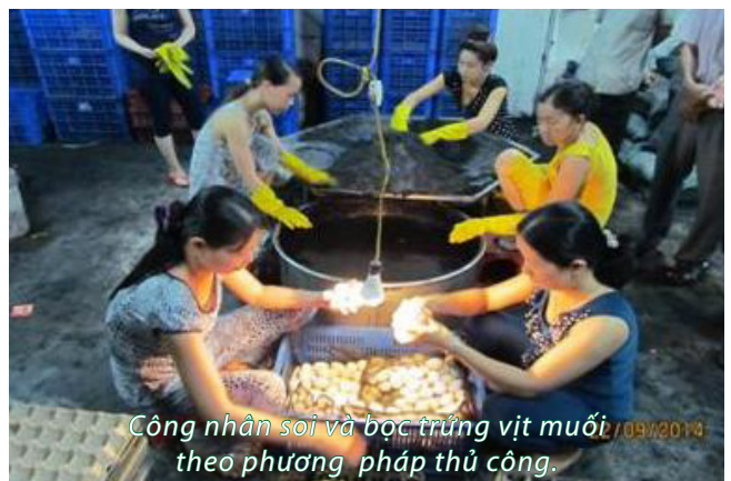
Công nhân soi và bóc trứng vịt muối theo phương pháp thủ công. /09/2014