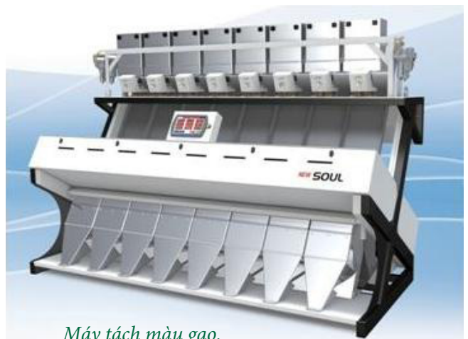
Máy tách màu gạo.