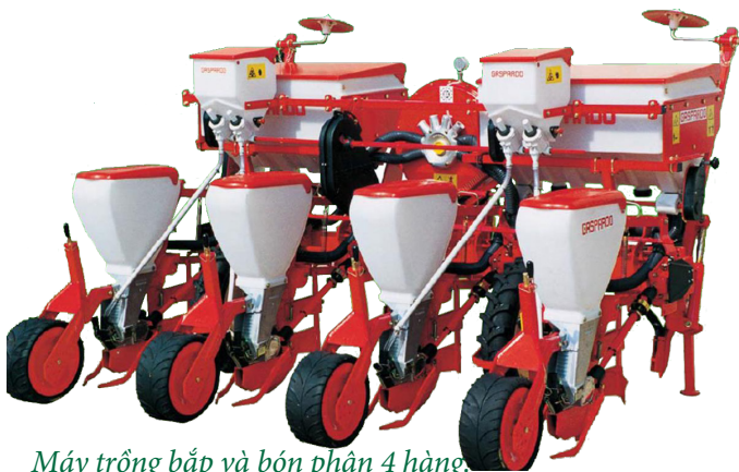
Máy trồng bắp và bón phân 4 hàng.