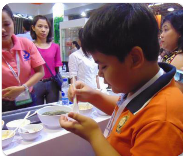
Dùng thử sản phẩm rong nho tại hội chợ Vietfish 2016.

Có bờ biển dài 3.260km với diện tích mặt nước khoảng 1 triệu km 2 , Việt Nam rất thích hợp cho việc phát triển ngành rong biển, đặc biệt là vùng miền Trung có bờ biển đá và dải biển thiên nhiệt độ hẹp. Tại Việt Nam đã xác định được 800 loài rong biển. Trong đó, nhiều chi có sản lượng tự nhiên lớn như rong nâu ( Sargassum , Hormophysa , Hydroclathrus ); rong đỏ ( Gracilaria , Hydropuntia , Hypnea ); rong lục ( Ulva , Chaetomorpha , Cladophora ), rong nho ( Caulerpa lentillifera ) và một số loài khác, được nuôi trồng trong ao đĩa, vịnh, bãi triều ven biển. Các nghiên cứu tại 10 đảo thuộc quần đảo Trường Sa (Trường Sa lớn, Nam Yết, Sơn Ca, Song Tử Tây, Phan Vinh, Tốc Tan, Thuyền Chài, Đá Tây, Sinh Tồn và Đá Nam) đã xác định được 255 loài rong biển thuộc 4 ngành là khuẩn lam ( Cyanophyta ), rong đỏ ( Rhodophyta ), rong nâu ( Phaeophyta ) và rong lục ( Chlorophyta ). Trong đó, rong đỏ chiếm ưu thế hơn cả (136 loài, chiếm 53,3%), tiếp theo là rong lục (69 loài, chiếm 27,0%), khuẩn lam và rong nâu có số lượng bằng nhau (25 loài, chiếm 9,8%).